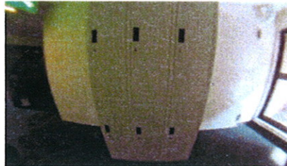
■ ロッカー ■