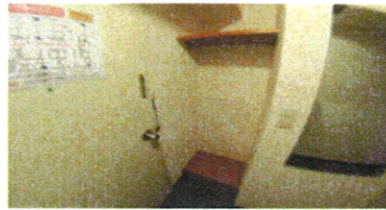
■ 室内棚 ■