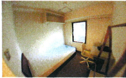
■ 室内 ■