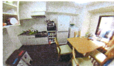
■ 共用DK ■ ■ 現地案内図 ■