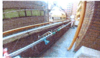
■ 共用物干場 ■