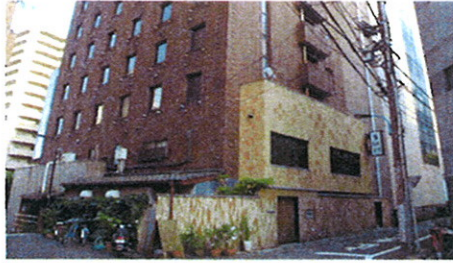
■ 外観 ■