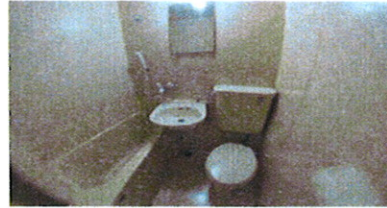
■ UB ■