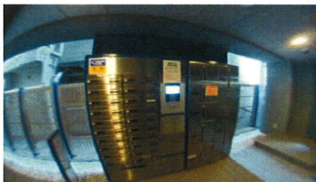
■エントランス・宅配BOX■