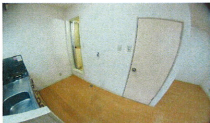
■洗濯機置スペース■